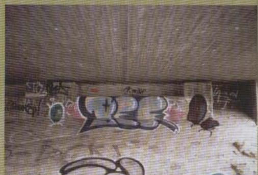
Bek Mako - 2002