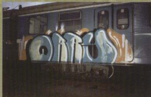
Offy - 2003