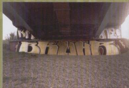
Bk Mhr - Uppsala