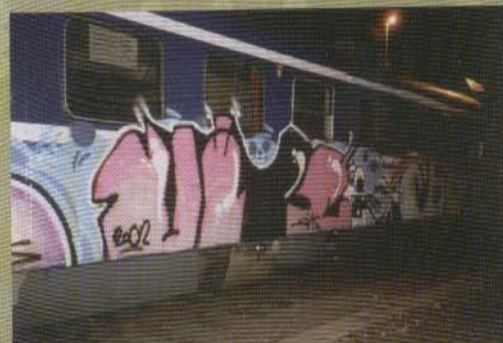
Vifl - GL-pendeln