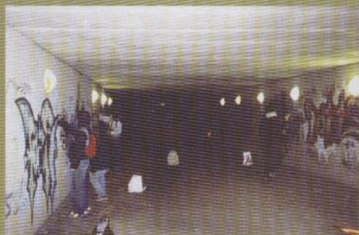
Full fart i Lund - 2002