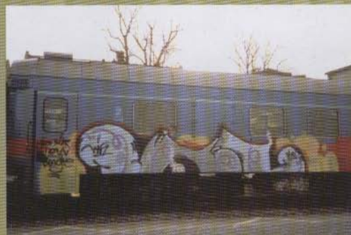
Vif1 - 2003