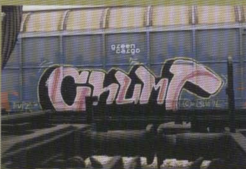
Chunt - 2002