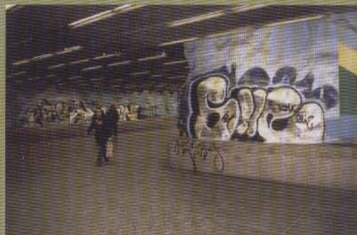
Sile - 2003