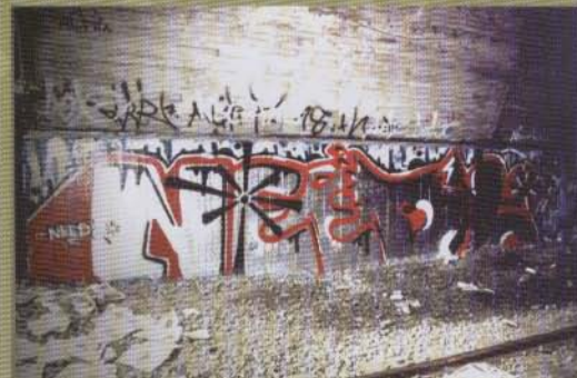
..och färdig - 2002