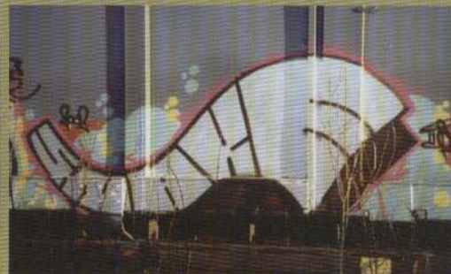
Snake - 2002