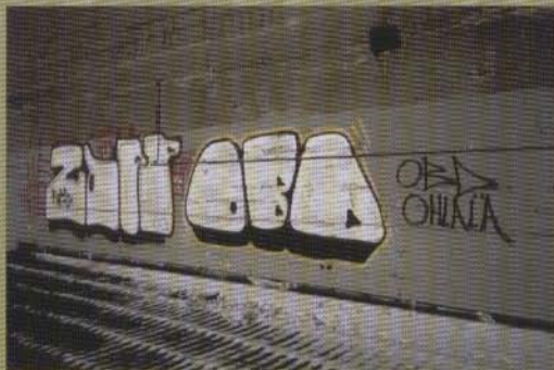
Zapp Öbd - 2003