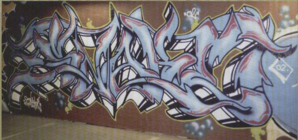
Snake - 2002