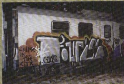
Fups - Vättertåg