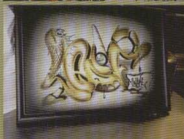
Leif - 2002