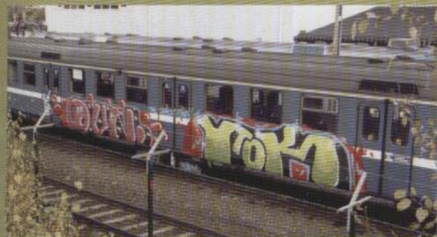
0vn Ytok - 2002