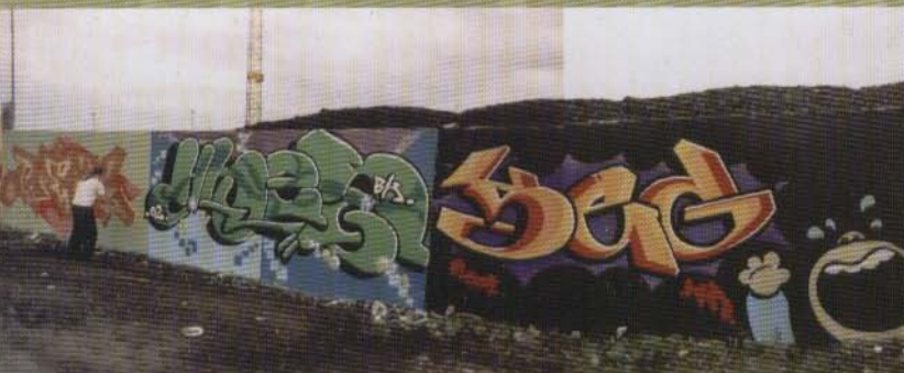
(Recks) Hnes Seg - Norrköping