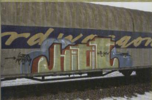
Hitit - 2002