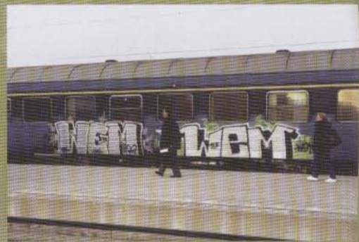
Wem Wem - 2003