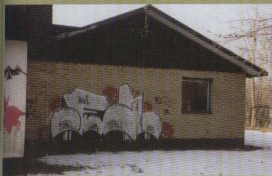
Fool - 2003