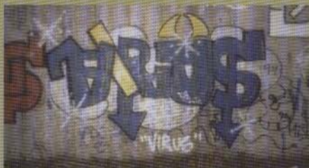
Virus (snakes 1:a) - 1999