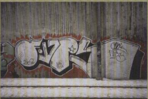
Fups - 2003