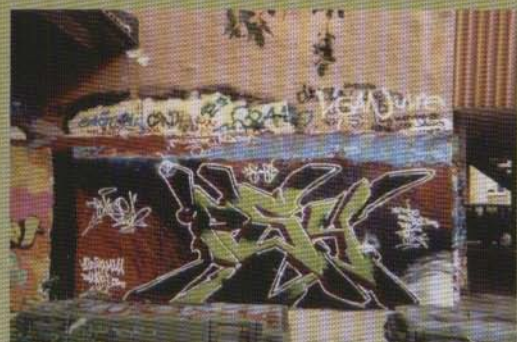
Psy - Umeå