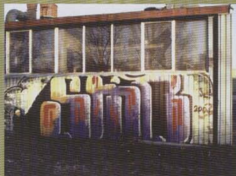
Smb - 2003