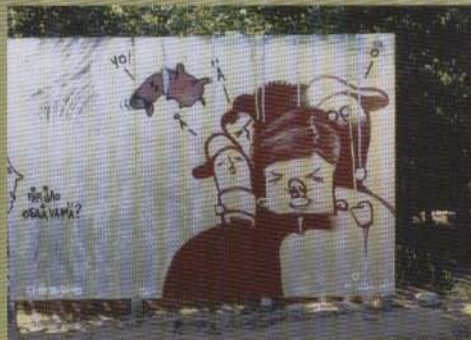
Figure - 2002