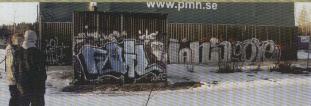
Foil - 2003 (Ians Øoye - 2001)