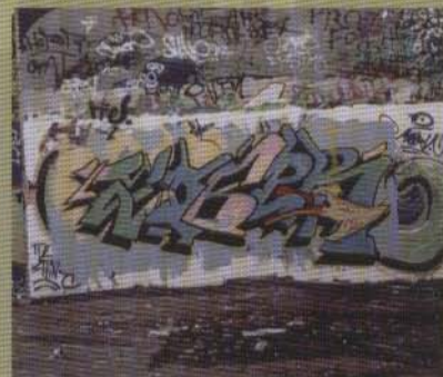
Zober - Rättvik