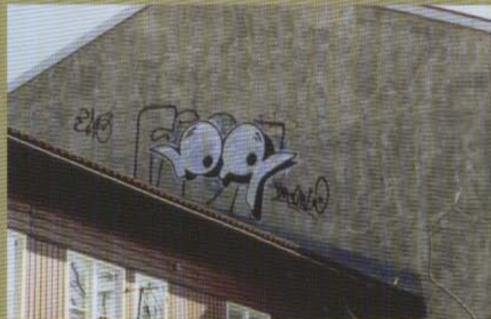
Dr - 2002

S: Umeåscenen har gått ner sig kraftigt de senaste åren. Många av den äldre generationens målare har flyttat, dessutom har rätt många blivit inaktiva, och många som börjar måla graffiti lägger av nästan direkt. Jag hoppas att detta bara är en tillfällighet, för Umeå har hållit en rätt bra klass genom tiderna, enligt mig.