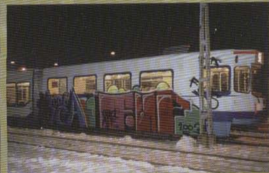
Scuba Fup - Spårvagn