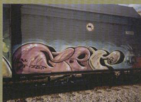
Zet - 2002