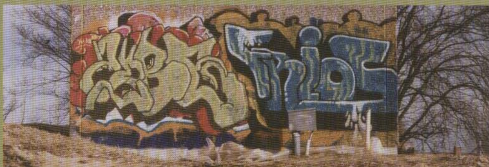
Zobe Frios - 2003