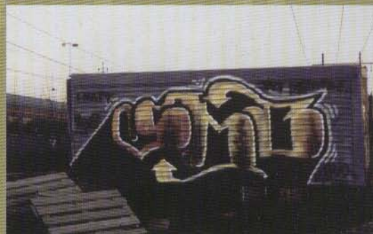
Smb - 2003