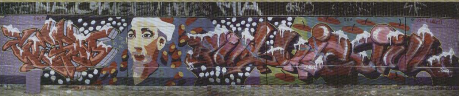
Cesm (Caracter av Ruskig) Ruski-Jul - 2002