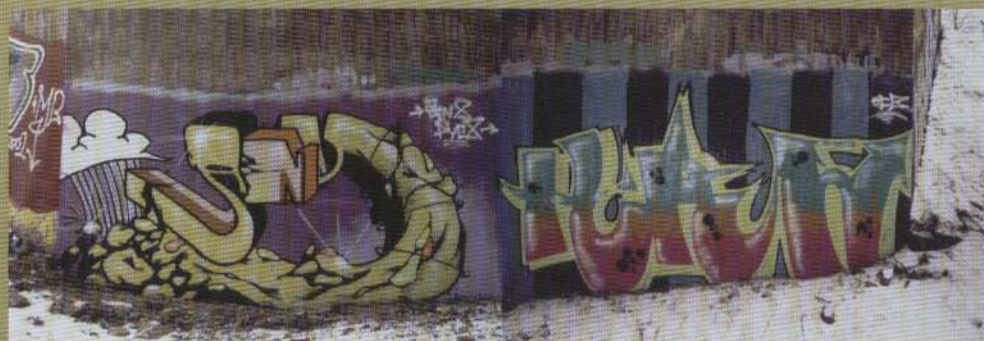
Ians Kire - 2002