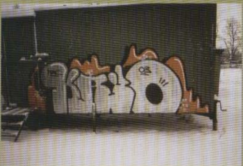
Kryo - Uppsala