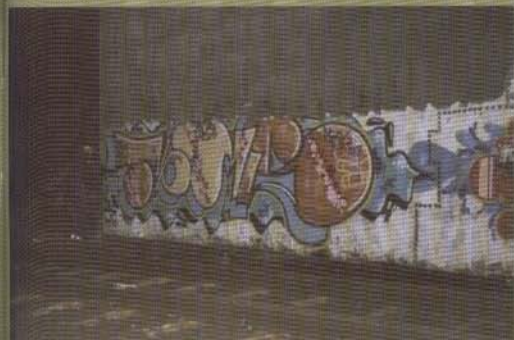
Noms - 2002