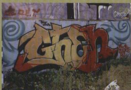
Ghen - Rättvik