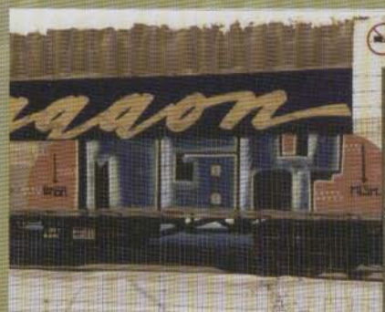
Mgk - 2002