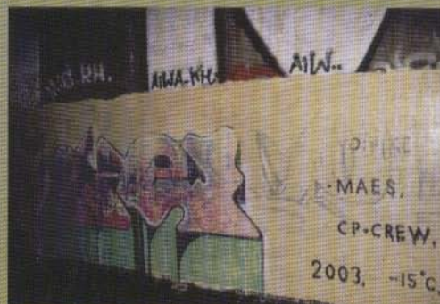
Maes - 2003