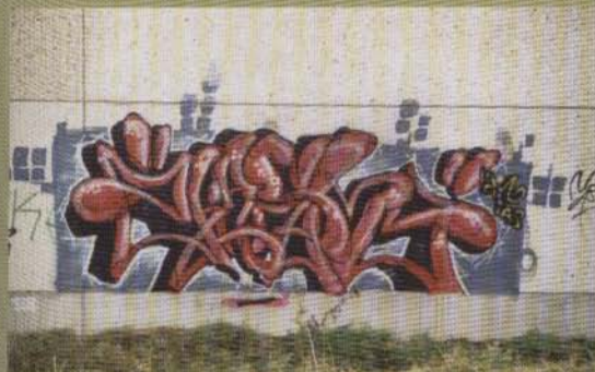
Kash - 2002