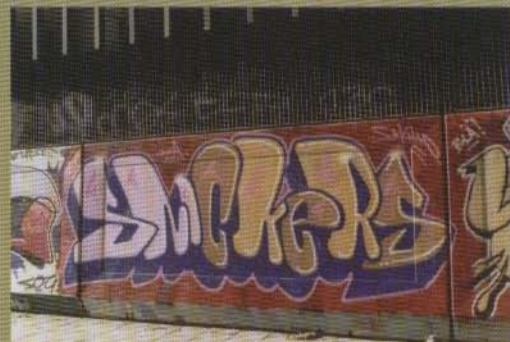
Snickers - 2002