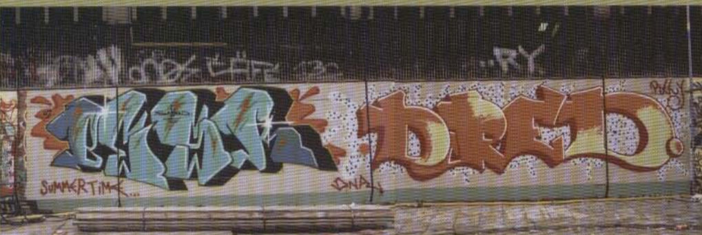
Besk Dred - 2002