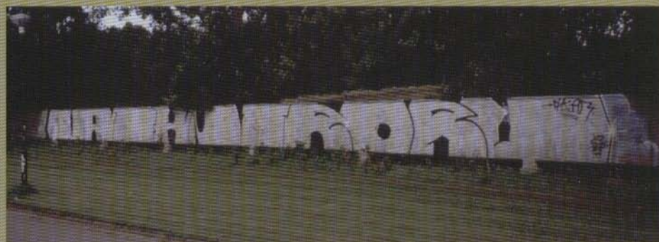
Vafantroru - Örebro