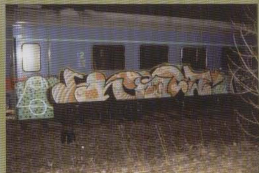
Hacker - 2002