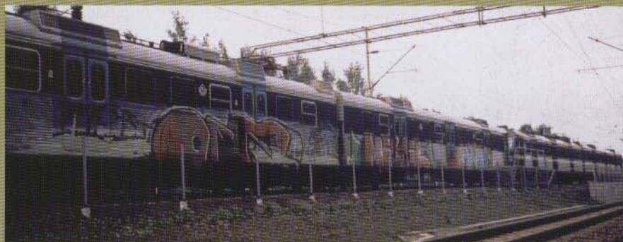
Off Misil (Mhrs) - 200