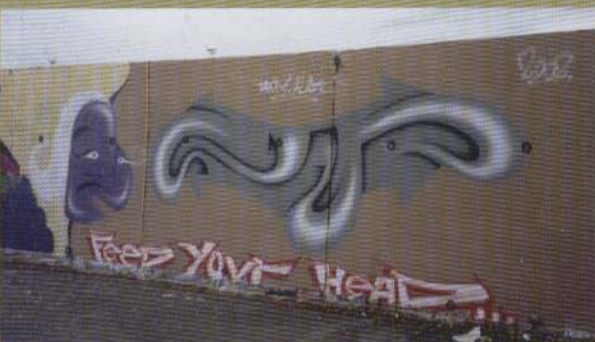
Deom - Norrköping