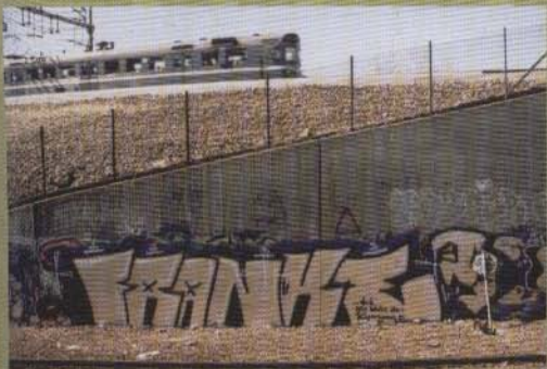
Franke - 2002