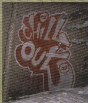
Chill - Östersund