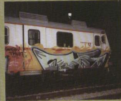
Chs - Östgötapendeln