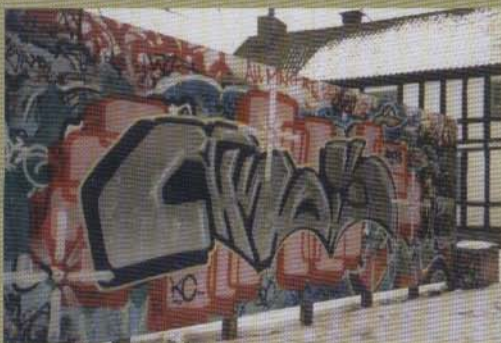
Akos - 2003