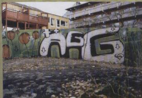
Ägg - 2002