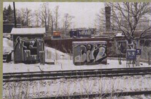
Fy Cia Li - 2003