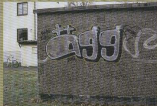
Ägg - 2002