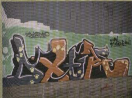
Dextr - 2001