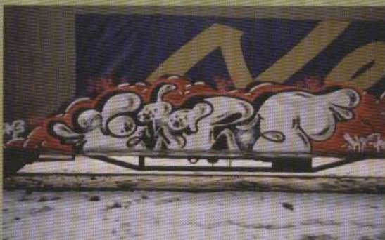
Yoga - 2002