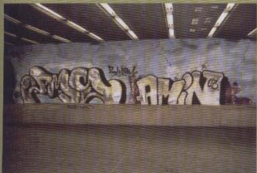
Pms Amin - 2003