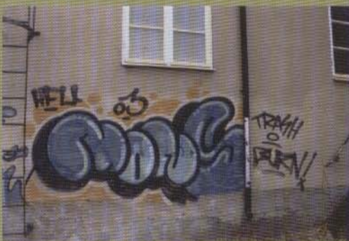
Mons - 2003