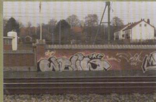
Helig - 2002