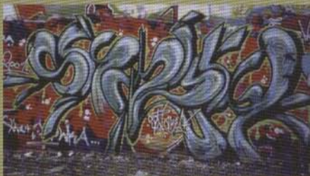
Snaker - 2002