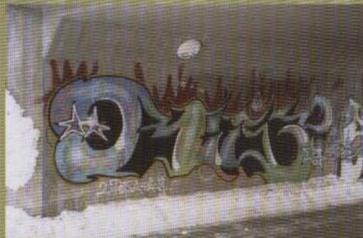
Rise - Örebro