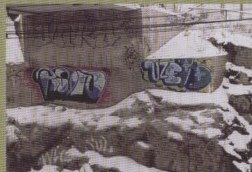
Ruin Uzek - 2003