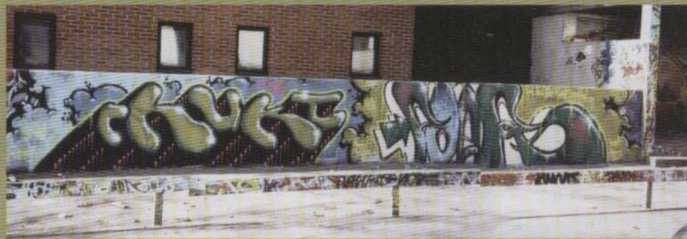
Phukt Poer - 2003