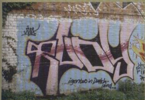
Rudy - 2002