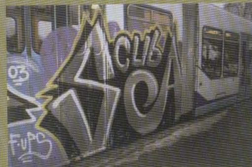
..Scuba - Spårvagn