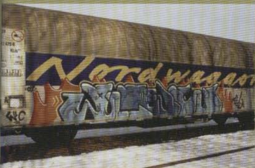
Rec - 2002