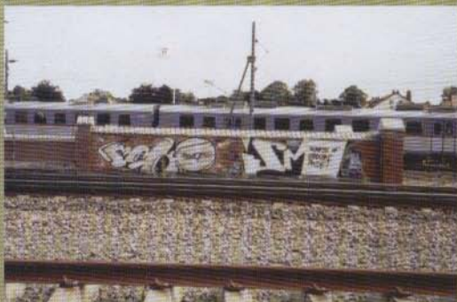
Mako Ism - 2002