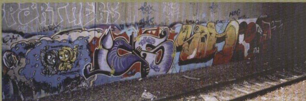
Kin Ics Sad Lotus Dirte - 2002