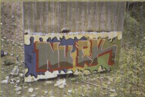
Nuek - Borlänge