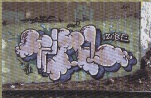
Fiol - 2003