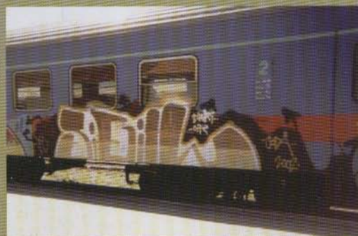
..Sigill - 2002