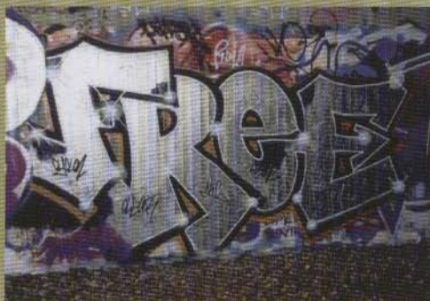
Free - 2003