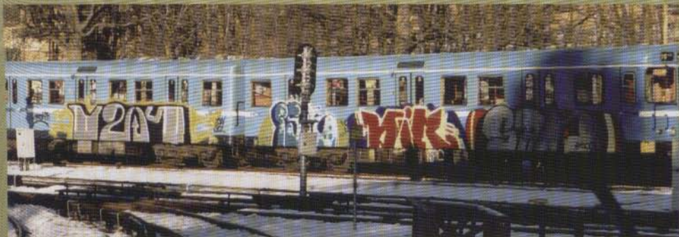
Y2k Isr Dir Sad - 2003