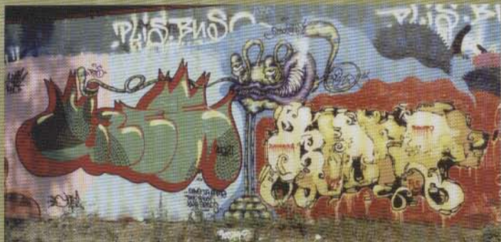
Uzee Kin Kropp - 2002