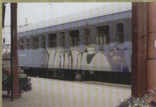
Th Nrc - 2002