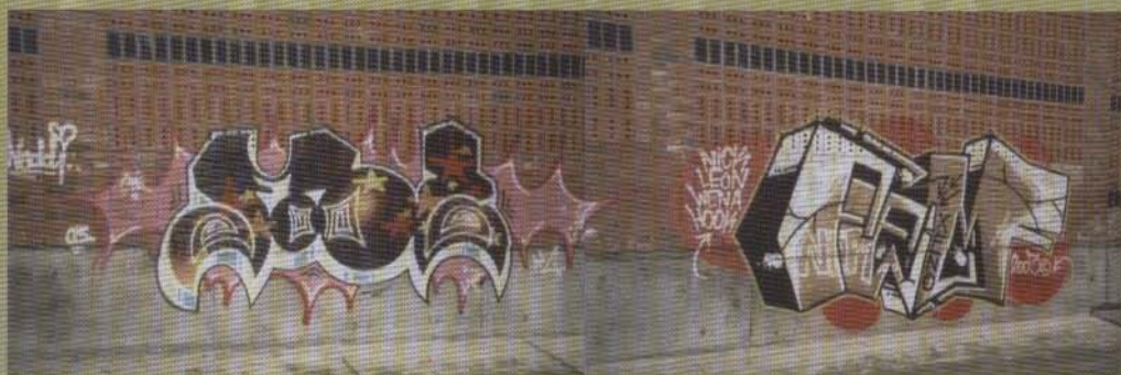
Fool Fem - 2003